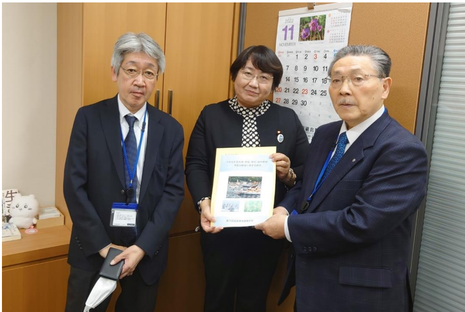
高橋千鶴子衆議院 議員に提言書手交