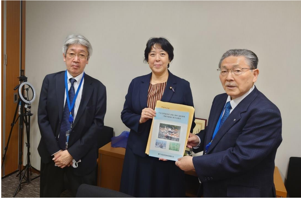
田名部匡代参議院 議員に提言書手交